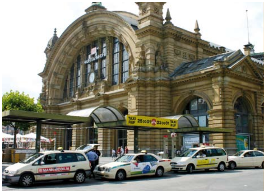
Erfolgreiche Taxiunternehmer warten am Bahnhof auf Fahrgäste

Jahr an Gestattungsgebühren für den Flughafen ein. Demgegenüber nehmen sich die Mitgliedsbeiträge recht bescheiden aus. Wenn man es wirtschaftlich betrachtet, ist die Taxi-Vereinigung schon lange keine reine Berufsvertretung mehr. Sie hat sich in den letzten Jahren immer mehr zu einem Wirtschaftsbetrieb entwickelt, der ganz eigene finanzielle Interessen verfolgt. Das darunter die Qualität der gewerbepolitischen Arbeit leidet, hat man zuletzt bei der dilettantischen Behandlung des Tarifantrages gesehen. Vielleicht sollten die TV-Vorstände weniger wirtschaftliche Interessen des Vereins ver-